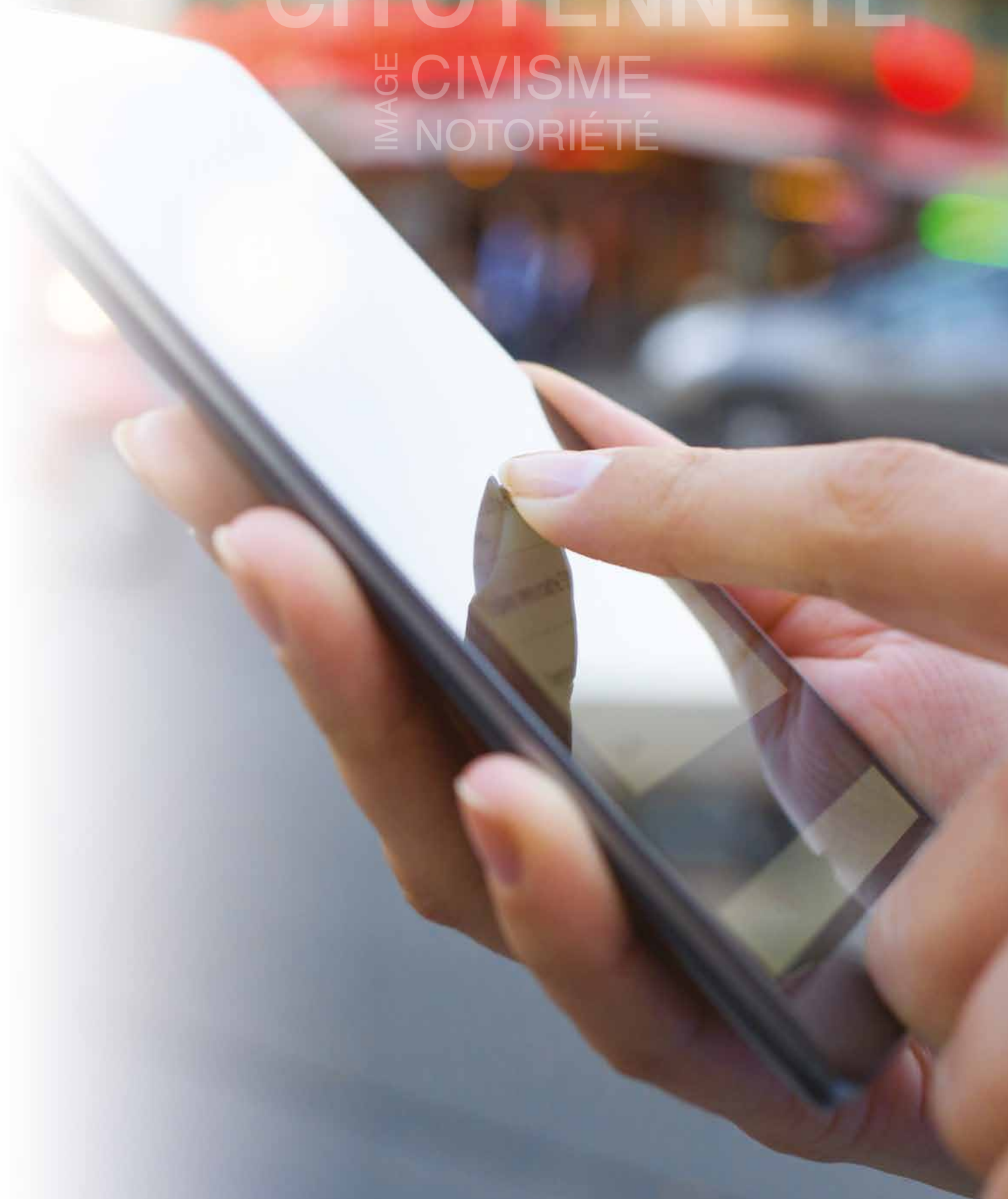
IMAGE CIVISME NOTORIÉTÉ